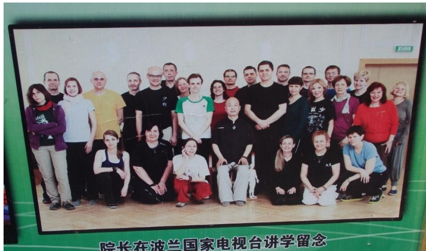
Fot. 5. Baner z wizerunkiem mistrza Shi Dehong oraz jego polskich uczniów zdobiący jedną ze ścian przed wejściem do szkoły mistrza w kompleksie pokazowo-treningowym sztuk walki klasztoru Shaolin