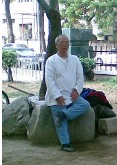
Fot.4. Zdjęcie mistrza Chen Yimin.