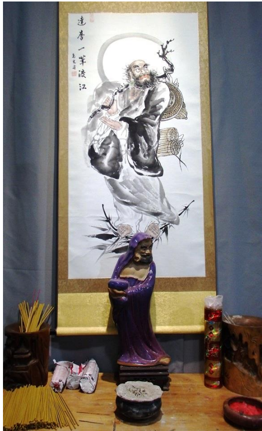
fot.1: Ołtarzyk ku czci Bodhidharmy na terenie klasztoru Shaolin.