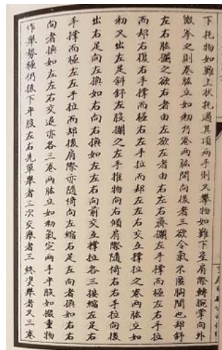
Fot. 2. Zdjęcie jednej ze stron książki zawierającej zapiski shaolińskich mnichów

Poniższy tekst jest opracowaniem fragmentów ww. rękopisów, wyselekcjonowanych przez autora opracowania ze znacznie większego, dwutomowego zbioru. Ze względu na różnice w słownictwie i gramatyce języków chińskiego i polskiego, poniższy tekst nie stanowi dosłownego tłumaczenia oryginalnego tekstu.