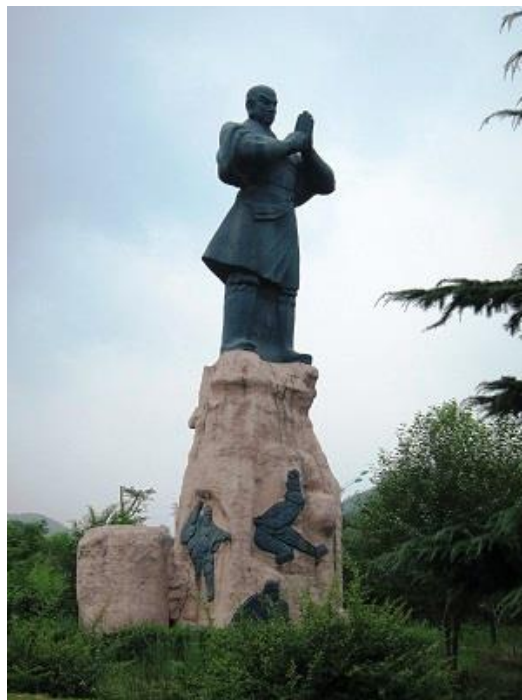
Fot. 1. Pomnik shaolińskiego mnicha usytuowany w odległości kilku kilometrów od klasztoru Shaolin

Informacje, uwagi oraz zalecenia shaolińskich mnichów dotyczące ich praktyk religijnych oraz ćwiczeń qigong